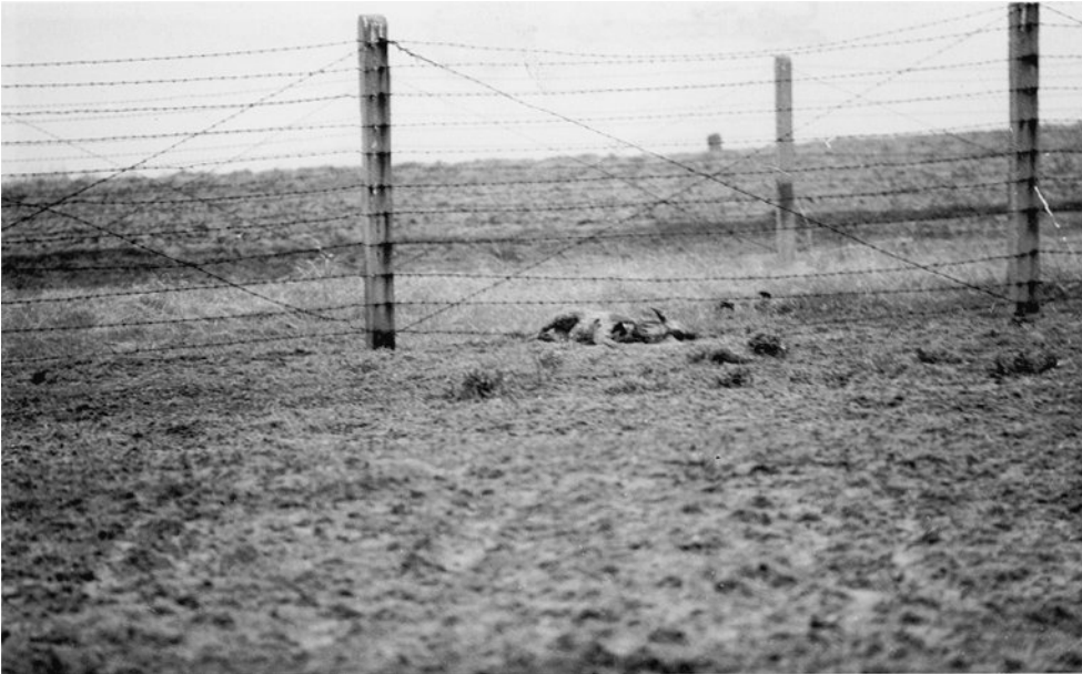
Verendetes Reh im Grenzstreifen (1966)