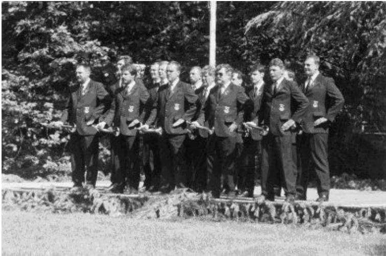
Deutsche Meisterschaften im Jagdhornblasen das Bläserkorps beim Wettkampfauftritt

Besonders gern hätten die Bläser im Jubiläumsjahr den Titel des Deutschen Meisters errungen. Sie wurden die drittbeste Gruppe Deutschlands. Und das ist doch etwas, oder?