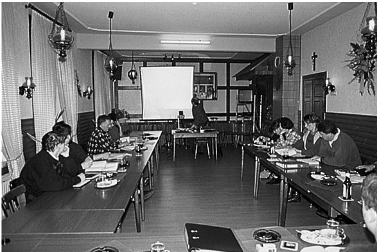
Jungjägerausbildung 1997 in der Gaststätte "Zum Alten Fritz" in Nesselröden

Sie ist nicht einfach und verlangt dem angehenden Jäger einiges ab. Zur Zeit findet in der Zeit von September bis Mai des darauffolgenden Jahres zweimal in der Woche ein zweistündiger Unterricht statt, in dem die verschiedensten Fächer unterrichtet werden. Ökologie, Wildtierkunde, Wildkrankheiten, Hege und Jagdbetrieb, Jagdrecht, Waffenkunde, Hunde, sowie Behandlung erlegten Wildes und noch einiges mehr steht auf dem Lehrplan. Im Frühjahr kommen Reviergänge - zumeist am Sonntag-vormittag - und an den Samstagen etliche Übungsschießtermine hinzu. Die vierteilige Prüfung (Schießen, Reviergang, schriftliche und mündliche Prüfung) schließt für den Jungjäger eine stressige Zeit ab.