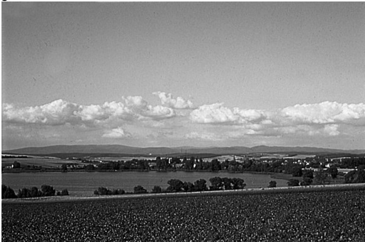
Der Seeburger See, "das Auge" des Eichsfeldes

Intensive Landwirtschaft und der relativ geringe Waldanteil von etwa 13 Prozent bestimmen das Landschaftsbild. Trotzdem verfügt die Jägerschaft Duderstadt über reiche landschaftliche Schönheiten, wie das Naturschutzschutzgebiet Seeburger See, eines der Wahrzeichen des Eichsfeldes und mit 85 Hektar der größte natürliche See Südniedersachsens.