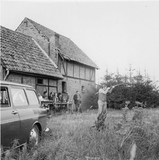
Schießstand Rote Warte 1971