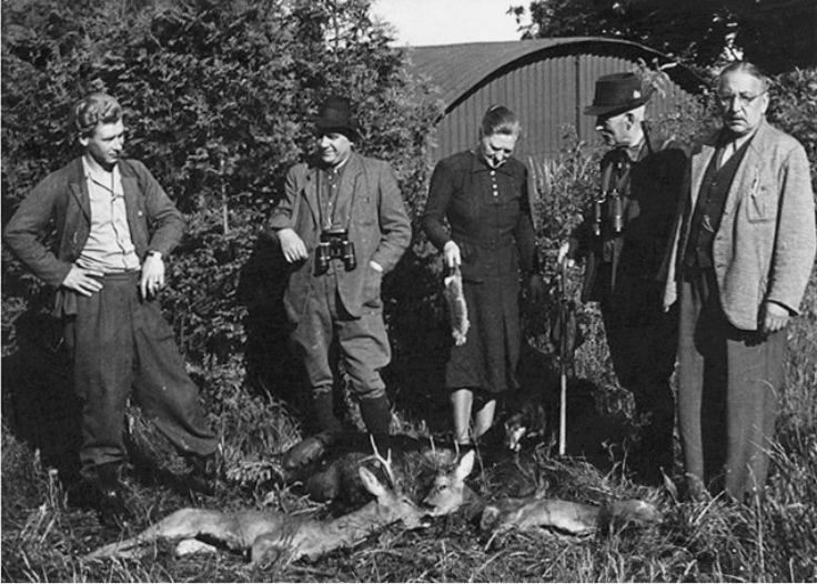
1951: Nach einer Jagd im Revier Desingerode