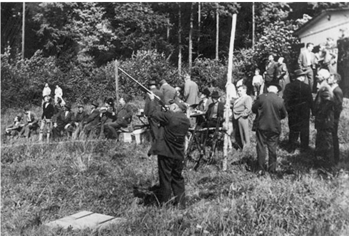
Schießstand "Pappschachtel" in den 50er Jahren (erster Stand des WTC Gieboldehausen)

Das Übungsschießen auf Tontauben, heute pazifistischer Wurfscheiben, wurde auf dem Eichsfeld schon immer sehr eifrig gepflegt. Bei Breitenberg bestand am "Alten Forsthaus Hübenthal" ein Schießstand, der von 1952 bis 1964 von der Jägerschaft genutzt wurde, wovon heute sicher nur noch wenige wissen. Im